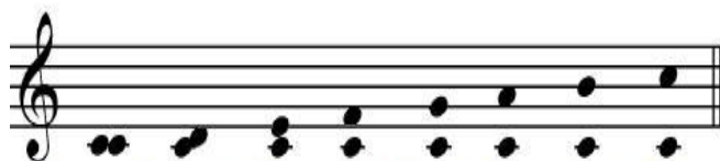
Unisono Seconda Terza Quarta Quinta Sesta Settima Ottava